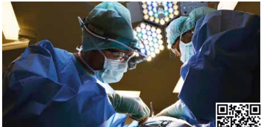
Eine Neuaufstellung des Gesundheitssystems in NÖ sorgt für Sicherheit

Aufgrund des europaweiten Mangels an Pflegekräften und Mediziner*innen wird auch die Situation in Österreich weiter herausfordernd bleiben. Ein zukunftsfittes Gesundheitssystem muss das darin arbeitende Personal bestmöglich schützen, unterstützen und vor