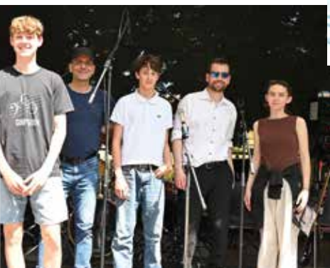
Die Jugend live on stage