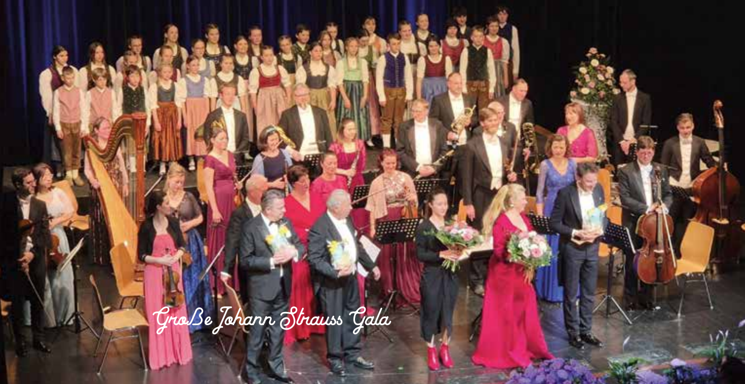
Im Stadttheater Berndorf konzertierten die Spatzen bei der „Großen Johann Strauss Gala“