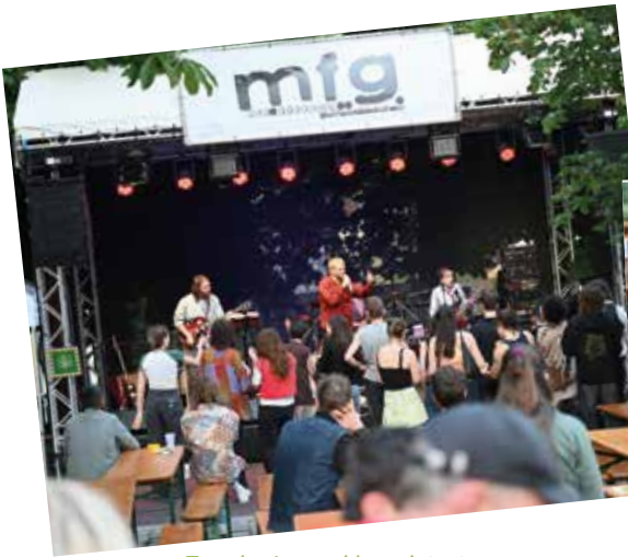
Tag der Jugend begeisterte