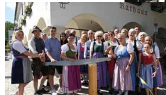
Mit vereinten Kräften und der Volkstanzgruppe