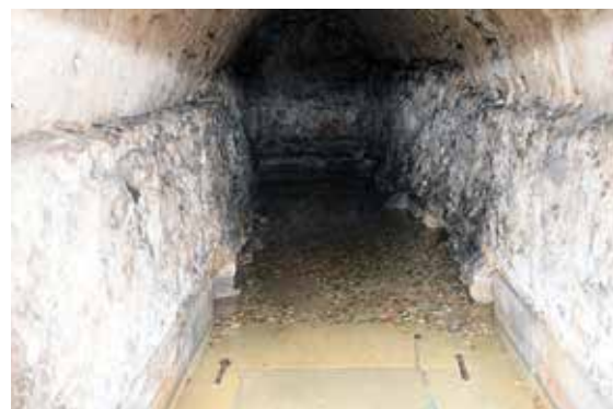
Das Quellwasser wird gefasst