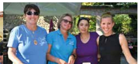
Die Damen vom Wettsägen