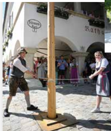
Der Maibaum wurde umgesägt