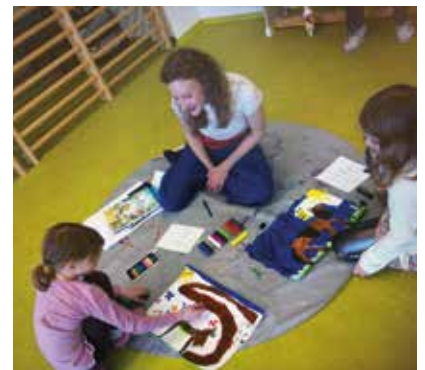
Auch die Kreativität wurde bei diesem Projekt gefördert.