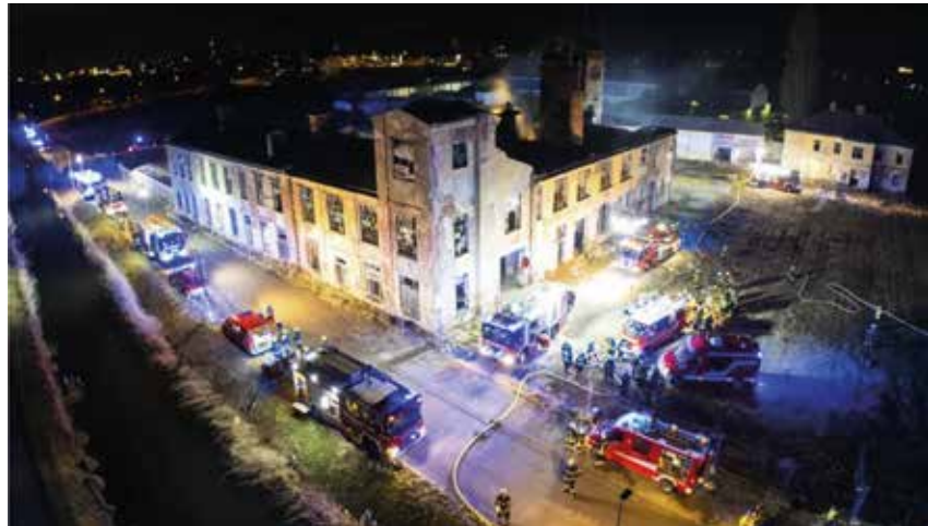
Ein Brand in der ehemaligen Bleiwarenfabrik löste einen Großeinsatz aus.

Laut Polizei war zu diesem Zeitpunkt nicht klar, ob sich im baufälligen Fabriksgebäude noch Personen befinden. Sofort wurde ein Atemschutztrupp zur Personensuche ins Erdgeschoß geschickt, das Obergeschoß konnte aufgrund von Einsturzgefahr nicht be-