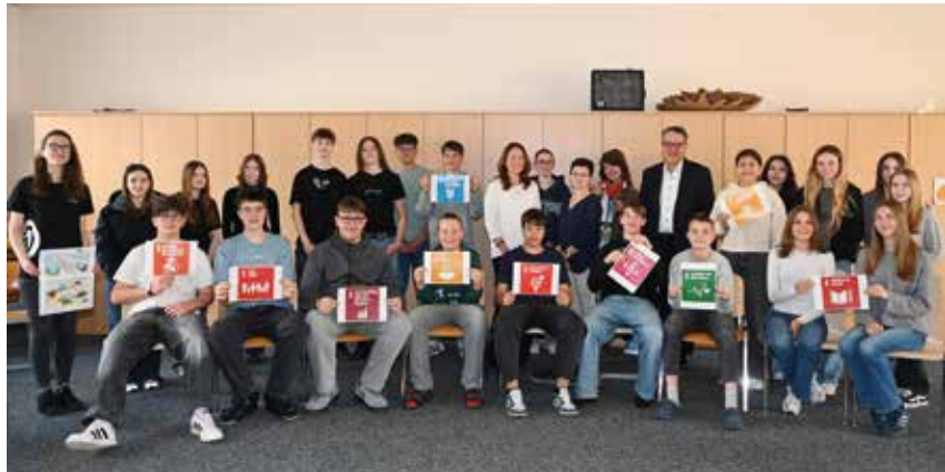
Die 17 Nachhaltigkeitsziele standen bei den diesjährigen Workshops von Südwind NÖ im Zentrum.

Die Schülerinnen und Schüler diskutierten über Verteilungsgerechtigkeit und Nachhaltigkeit und reflektierten dabei auch ihre eigenen Lebenswelten. Was ist Lebensqualität und was brauchen wir für ein gutes Leben? Besonders wichtige Punkte waren für die Jugendlichen Gesundheit, Familie, Wohnen und Bildung.