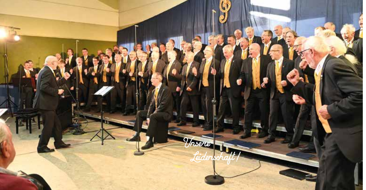
Der Gumpoldskirchner Männerchor MACH4 sorgte für Schwung.