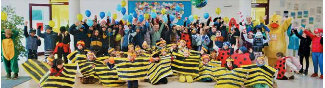
Ein buntes Faschingstreiben gab es beim allerersten Faschingsumzug mit Trubel und farbenfrohen Kostümen.

Neues aus der Schulischen Nachmittagsbetreuung