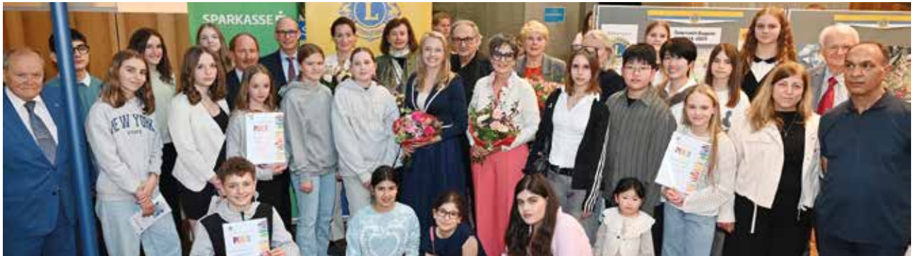
In der Sparkasse Baden wurde auch heuer wieder der Friedensplakatwettbewerb durchgeführt. Mit dabei: Die MMS Gumpoldskirchen.