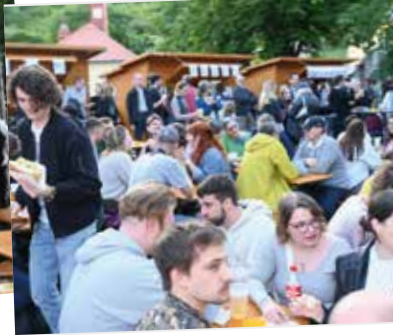
Cooler Sound und coole Unterhaltung