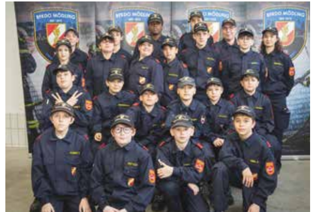
19 Jugendliche aus unserer Feuerwehr nahmen beim Wissenstest und -spiel des Bezirks Mödling teil.

Beim Wissenstest müssen die Jugendlichen Fragen rund um das Feuerwehrwesen beantworten. Weiters Geräte zur Brandbekämpfung und zur technischen Hilfeleistung zuordnen und deren Funktion beschreiben, Knoten aus dem Feuerwehrdienst beherrschen sowie Dienstgrade erkennen. In mehreren Schwierigkeitsstufen können Feuerwehrjugendmitglieder Jahr für Jahr ihre Leistung steigern. Die Abzeichen werden erst in der Stufe „Bronze“, dann „Silber“ und schließlich „Gold“ vergeben. Für die unter 12-Jährigen gibt