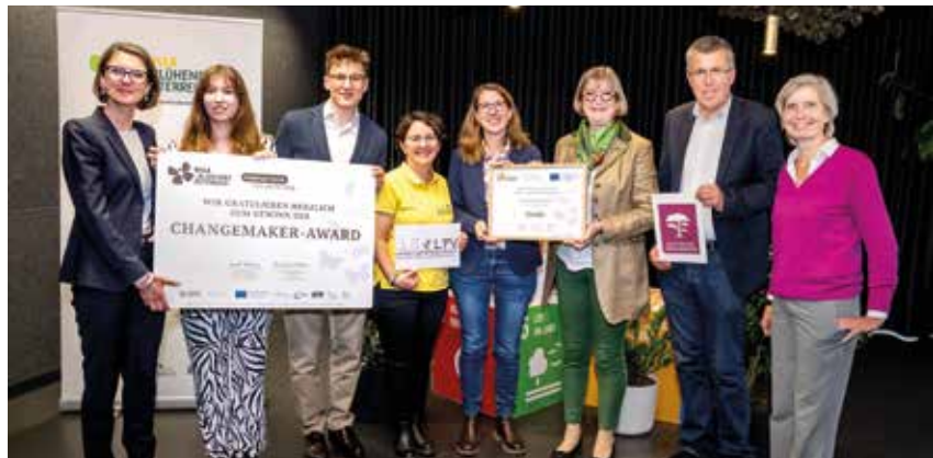
Volksschule Gumpoldskirchen ist Preisträger des Changemaker #nature - Wettbewerbs

Eine einmal jährlich gemähte Wiese in der Weinbaulandschaft wird durch die Pflanzung von 28 Hochstamm-Obstbäumen und 285 Heckensträuchern sowie Errichtung von Steinhaufen öko-