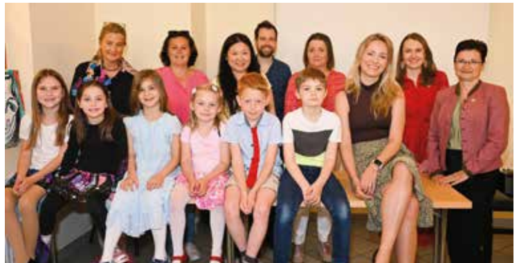
Fröhliche Stimmung bei der Muttertagsfeier