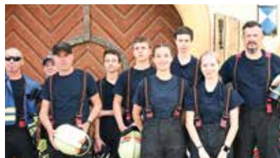
Die Feuerwehr sorgte für Sicherheit