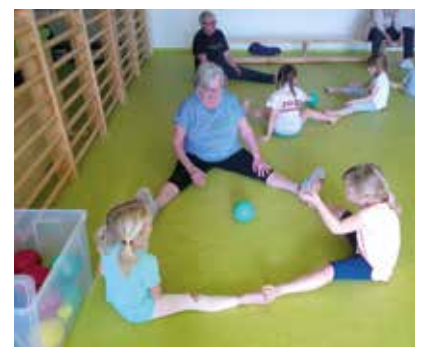
Ein gesunder Geist wohnt in einem gesunden Körper.