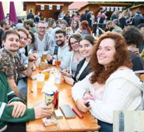
Gut gelauntes Publikum wohin man blickte