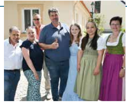
Das Miteinander stand im Zentrum