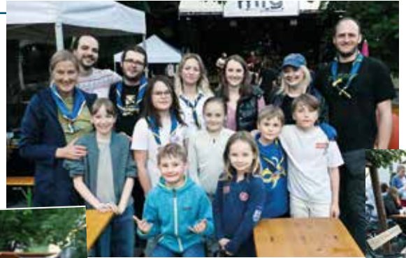
Die Pfadis sorgten für Gemütlichkeit