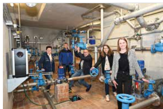
Modernste Technik sorgt für Sicherheit