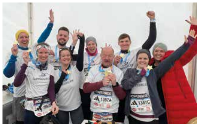
Acht Lehrerinnen und Lehrer der MMS Gumpoldskirchen standen beim Vienna City Marathon am Start.

Acht Lehrerinnen und Lehrer der MMS Gumpoldskirchen haben sich für dieses Schuljahr ein sportliches Ziel gesetzt und sind, im Zuge des Vienna City Marathons, zum Powerade Staffelmarahton angetreten. Dank einer großen Portion Motivation und einem passend abgestimmten Laufshirt, konnten auch frostige Temperaturen und eisiger Wind die hartgesotenen Teilnehmerinnen und Teilnehmer nicht davon abhalten, den Lauf erfolgreich zu beenden. Ein herzliches Dankeschön der Gemeinde für die Übernahme des Startgeldes. <<