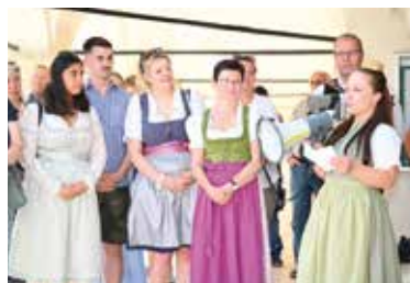
Ein herzlich willkommen von der Weinkönigin