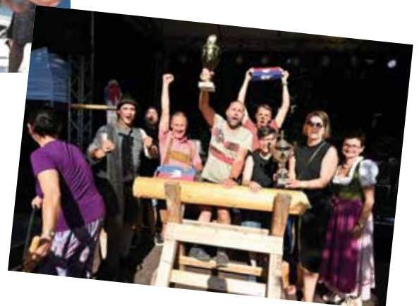
So sehen Siegerinnen und Sieger aus