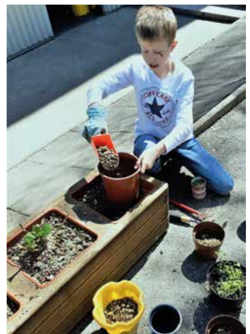
Mit Geschick und Engagement ging es zu den Projekten – Osterfreuden inklusive.