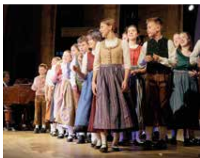
Aufritte, die ans Herz gehen: In Berndorf, Wr. Neudorf und in Kirchschlag sorgten die Gumpoldskirchner Spatzen mit ihrer Bühnenpräsenz für großartige Stimmung.