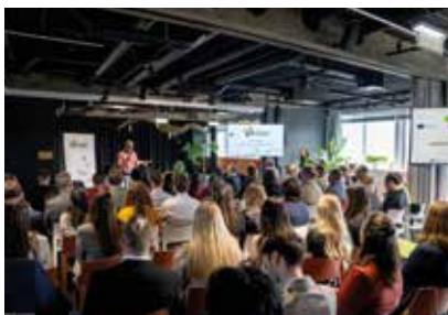
Gemeinsam mit den Partnerinnen und Partnern werden die Changemaker von heute unterstützt.

Im Zuge des Projektes entsteht mit den Kindern der Volksschule, unter fachlicher Betreuung durch die Biologinnen und Biologen des regional aktiven Landschaftspflegevereins Thermenlinie-Wienerwald-Wiener Becken, eine Fläche, die über die Jahre weiter gestaltet und die Entwicklung der Natur weiter beobachtet werden kann – ein Klassenzimmer in der Natur.