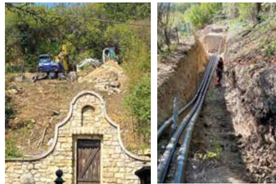
Die Leitungen zwischen den Hochbehältern wurden erneuert.