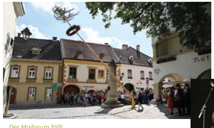
Der Maibaum fällt