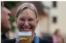
Die Jugend feiert

Drei Tage lang war der Kirchenplatz Zentrum des Marktfestes. Für den Eröffnungstag, auch Tag der Jugend, organisierten die Pfadfinder das Line Up für das Open Air Konzert mit den Bands „Butterbread“, „Keinabaoho“, „Capidilas“ und „Cassies“. Musikalisch startete auch der zweite Tag mit der Joe Zawinul Musikschule. Danach folgte eine Reihe traditioneller Höhepunkte: der Maibaumumschnitt, der punktgenau von statten ging und von Volkstänzen begleitet