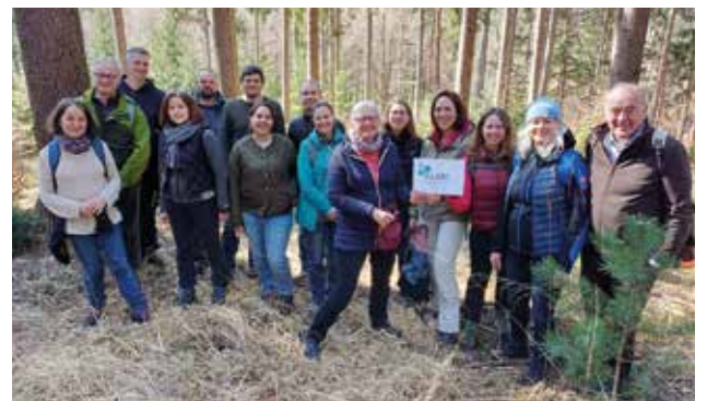
Eine Exkursion nach Pyhra unternahmen die Mitglieder der Modellregion Thermenlinie

Unter dem Motto „Wie mache ich meinen Gemeindewald klimafit?“ trafen sich Vertreterinnen und Vertreter der Mitgliedsgemeinden der Modellregion Thermenlinie, um sich über Strategien der klimafitten Waldbewirtschaftung auszutauschen. Im Zentrum standen Schlägerungen aber auch Biodiversität und Schädlingsbefall. <<