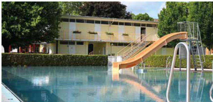
Unser Freibad einst und jetzt: Um den Betrieb auch weiterhin zu sichern, wurden die Tarife heuer moderat adaptiert.

Im Juni 1964 fand die Eröffnung des neu adaptierten Freibads statt. Die nächsten Sanierungsschritte sollten jedoch nicht lange auf sich warten lassen: Ende der 1980er Jahre wurde das Bad neuerlich saniert und mittels