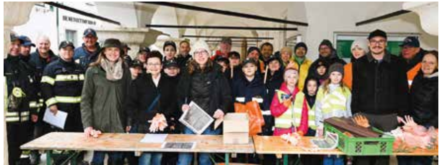
Unter den Rathausarkaden wurden die Rayons eingeteilt und Säcke, Handschuhe und Warnwesten ausgegeben.

Treffpunkt waren die Rathausarkaden, wo nicht nur Müllsäcke, Warnwesten