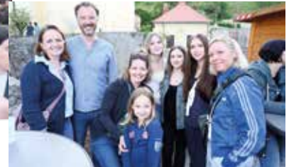
Geselliges Treiben bestimmte den Nachmittag