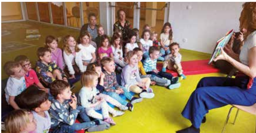
Noras Schaukelträume standen beim Österreichischen Vorlesetag im Kindergarten Bahngasse im Zentrum.

zu spielen und kreativ zu sein. Die Kinder der 4B waren sehr einfühlsam und machten sich große Mühe bei den Vorbereitungen. Zum Abschluss des gemeinsamen Vormittags wurde noch gemeinsam im Kindergartengarten gespielt und für die Volksschulkinder gab es ein kleines süßes Dankeschön.