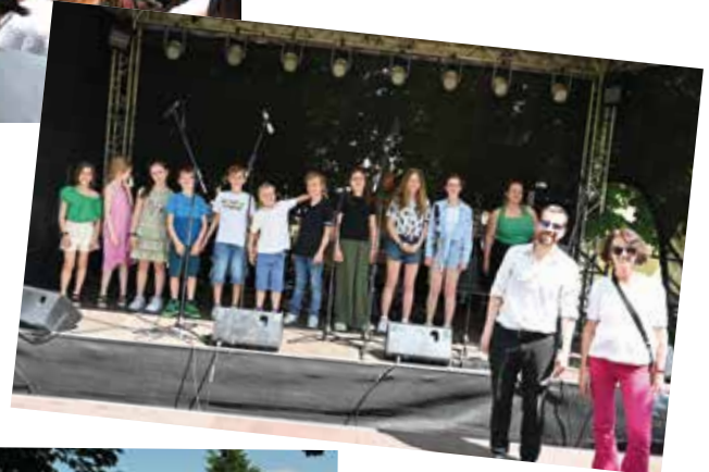
Jung und Junggeblieben