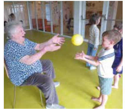
Gemeinsame Bewegung machte Kindern und Senioren Spaß.

Am 1. Mittwoch im Monat kommen zwischen 5 und 10 bewegungsbegeisterte Damen und Herren in den Bewegungsraum des Kindergartens und führen gemeinsam mit den Kindergartenkindern mit viel Geschick und Ausdauer die verschiedensten Bewegungsübungen und Spiele mit den un-