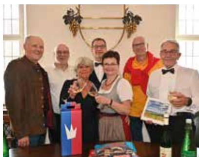
Unterwegs mit dem Gumpoldskirchner Männerchor MACH4: Sowohl beim Frühlingskonzert als auch beim Besuch des Mixed Voice Choir of Yorkshire sorgte MACH4 für Begeisterung.