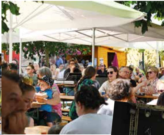
Verpflegung vom Feinsten