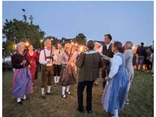
Den Abschluss bildete ein gemeinsames Lied am Feuer – für manche gefolgt vom mutigen Feuersprung, der die alte Sonnwend-Tradition lebendig hielt.