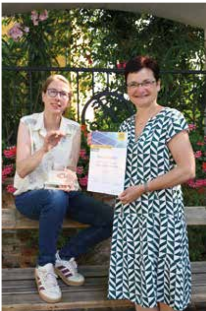
Wir sind beim Ausbau der Photovoltaik-Anlagen Bezirkssieger!