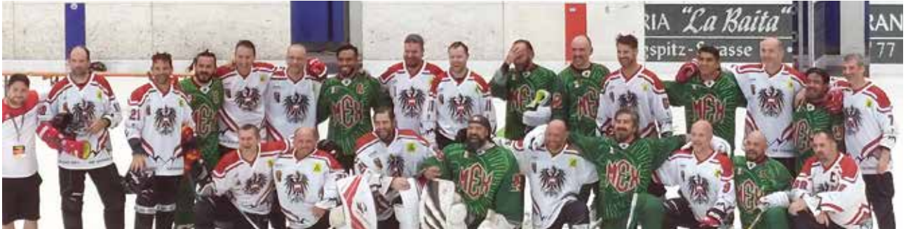
Die österreichische Seniorenmannschaft holte bei der Inlinehockey-WM Platz 9