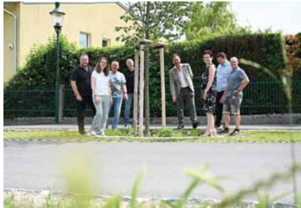
Die neugestaltete Badgasse präsentiert sich als Vorzeigefrastruktur

In nur fünf Monaten Bauzeit wurde der Straßenzug durch die Baufirma Leyrer + Graf generalsaniert. Dazu wurde zunächst der Straßenunterbau mit Kanal-, Wasser- und Strom-Infrastruktur erneuert, danach Fahrbahn mit Bankekt und Entwässerungseinrichtungen sowie ein zwei Meter breiter Gehsteig ausgeführt und 3.200 m 2 Nebenflächen gestaltet. Weingartenseitig wurde ein Schrägbord hergestellt. In den Parkbuchten wurden Rasengittersteine verlegt und die Fahrbahn auf der gesamten Länge 3,5 Meter breit ausgeführt. Um den Gegenverkehr ungehindert