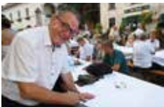
Bildung, Wirtschaft und Politik grüßt