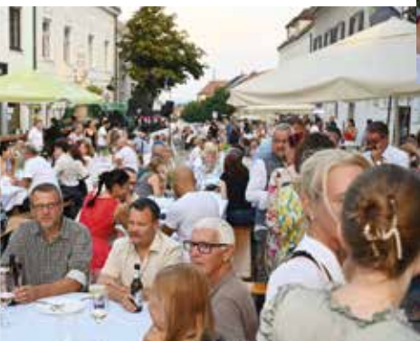
Für jeden Gusto das passende Angebot