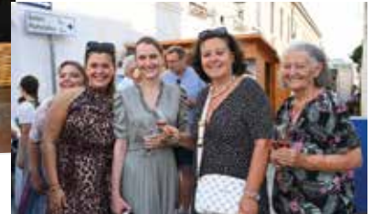
Strahlender Sonnenschein und strahlendes Lächeln