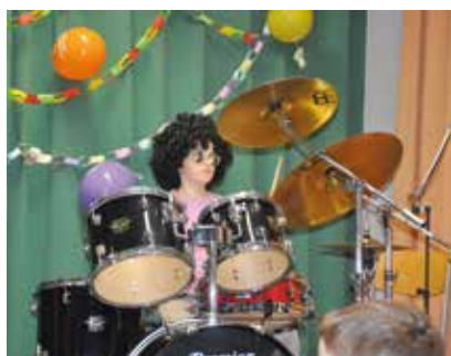
Die Joe Zawinul Musikschule Gumpoldskirchen freut sich auf ein spannendes musikalisches Schuljahr mit vielen Highlights!