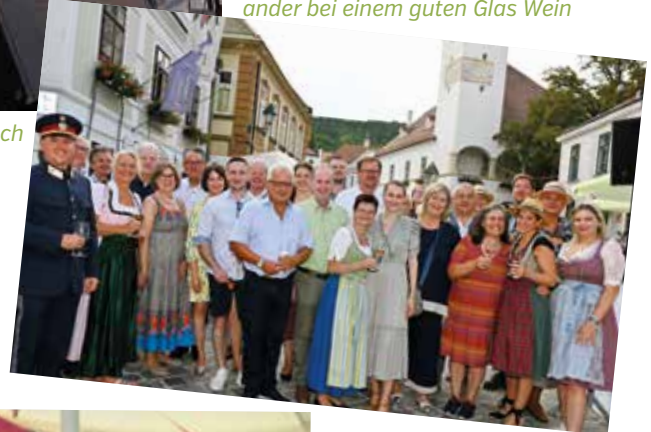
Die Fest- und Ehrengäste als Weinsommer-Fans