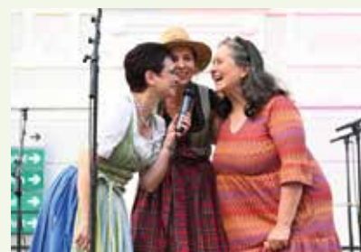
.. mm miteinander eröffnet