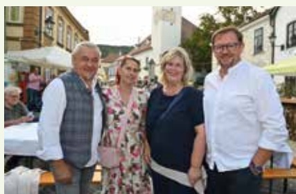
Der Weinsommer als einer der schönsten Traditionen ...