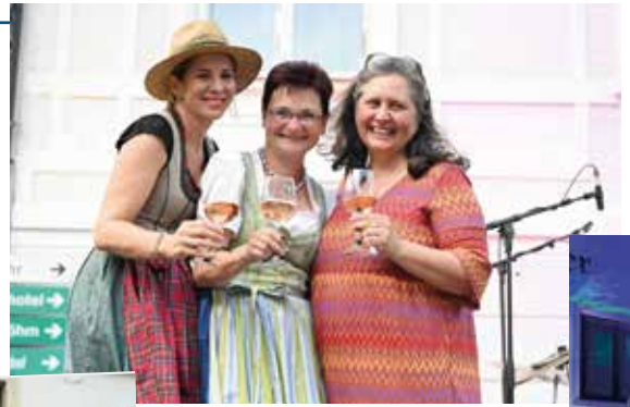
Der 10. Weinsommer wurde glanzvoll eröffnet