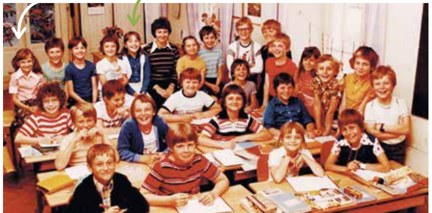
Die Schülerinnen und Schüler der 4. Volksschulklasse von 1977/78.