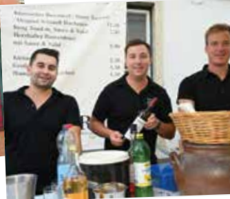
Herrliche Weine u.a. vom Weingut Krug