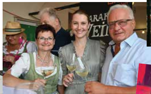
Ein Prost auf den Weinsommer 2025