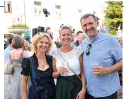
Der Weinsommer als geselliges Miteinander bei einem guten Glas Wein