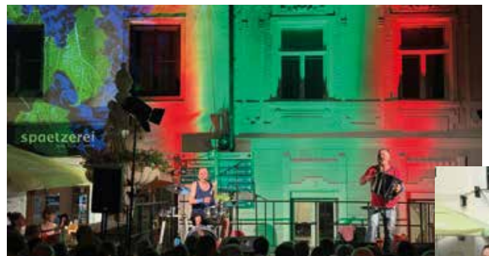
Attwenger rockte den Schrankenplatz