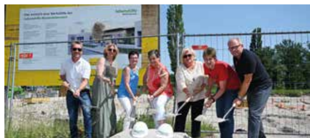
Gemeinsamer Spatenstich als gutes Omen

Das Bauprojekt überzeugt durch seine offene Gestaltung und nachhaltige Bauweise – Luft-Wasser-Wärme-Pumpe und Photovoltaikanlage am Dach sind damit ebenso Standard wie Klimafreundlichkeit und durchgängige Barrierefrei-