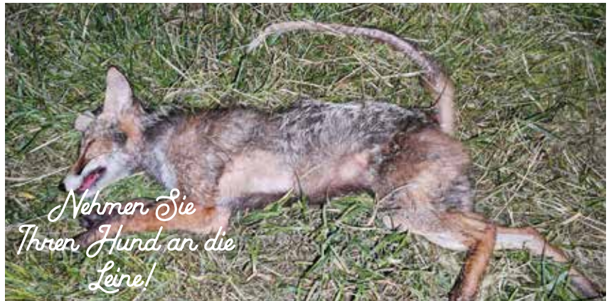
Die Fuchsräude stellt für Hunde und Katzen eine Gefahr dar, für den Menschen ist sie lästig.

Die Milbe ist so klein, dass sie nur unter dem Mikroskop erkennbar ist. Das Weibchen bohrt bis zu 1 cm lange Gänge in die Haut, um hier Eier abzulegen aus denen nach ca. 3 Wochen neue Milben schlüpfen, die dann über die Bohrgänge nach außen gelangen. Die männlichen Exemplare verbleiben auf