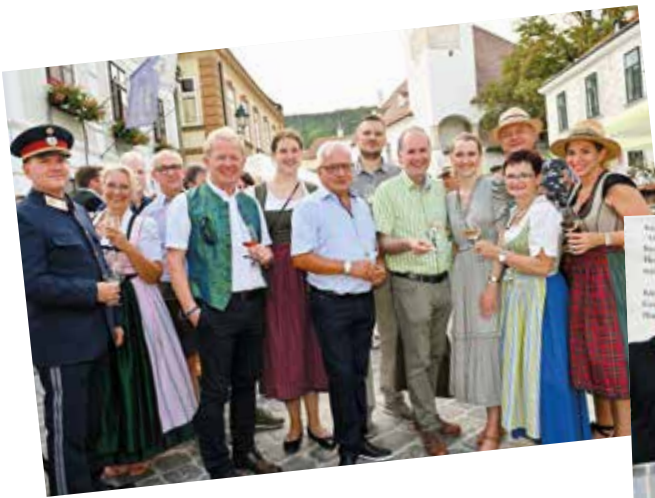
Zahlreiche Prominenz machte die Eröffnung zum Riesenerfolg