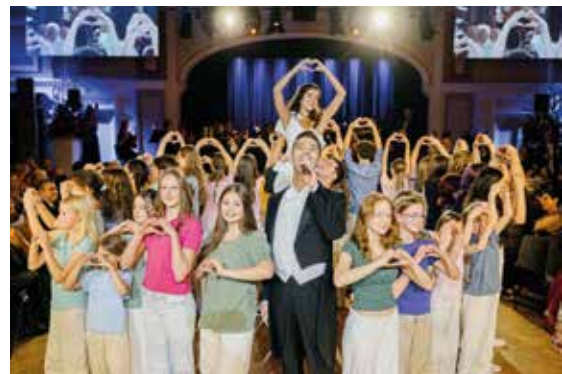
Die Spatzen beim Ball Royale der Stadt Baden