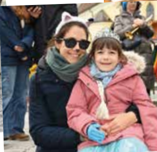
Fertig für die Maskenprämierung