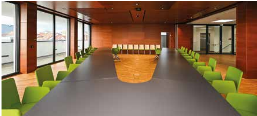
Ob im Gemeinderatssitzungssaal oder in den Abteilungen: Ein helles und freundliches Ambiente zeichnet das neue Gemeindeamt aus. Im Bild rechts: Die digitale Amtstafel beim Gemeinamtsportal.