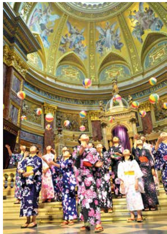
In traditioneller Yukata