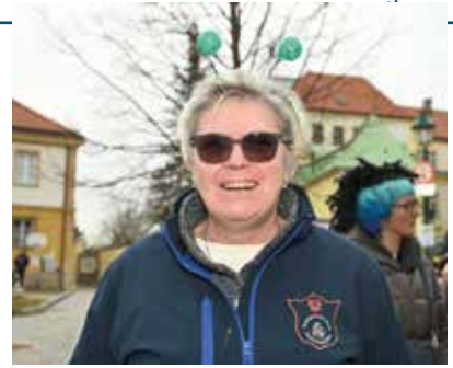
Fasching in vollen Zügen genießen