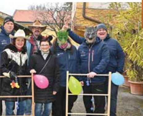
Allerlei Spiele machten den Kinderzahnkampf zum Vergnügen