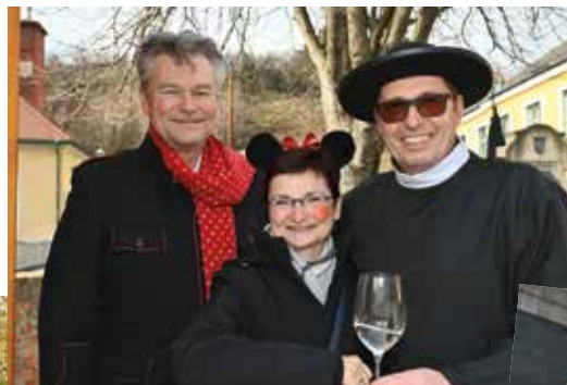
Prost, prost auf die 5. Jahreszeit