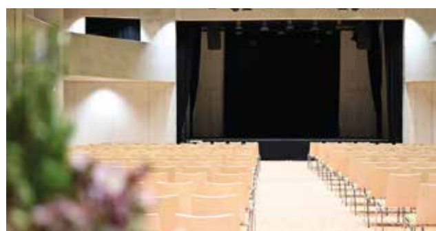
Das Atrium macht Veranstaltungen zu Erlebnissen