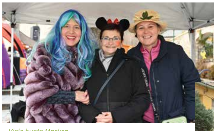
Viele bunte Masken