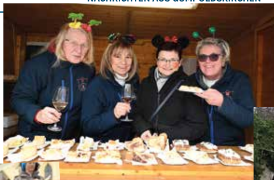
Auch Mehlspeisen fehlten nicht