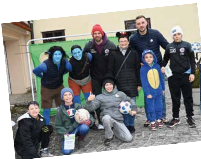
Die Vereine organisierten einen lustigen Kinderzahnkampf