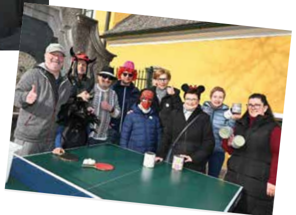
Auch Tischtennis und Dosenschießen fehlte nicht