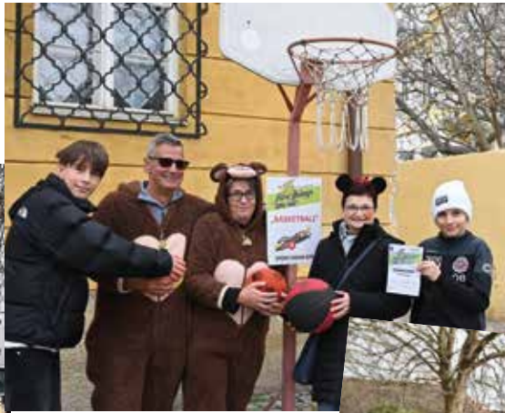
Geschicklichkeit ist Trumpf