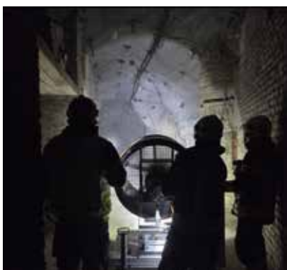
Der Großraumlüfter leistete gute Dienste