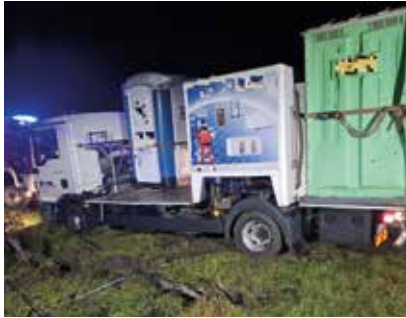
Ein vollbeladener Lkw versank in der Lang