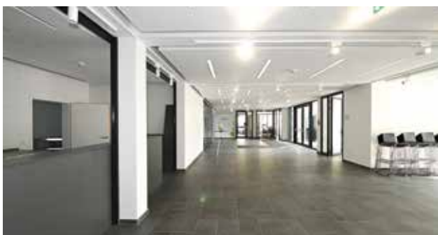
Das offene Foyer bietet viele Möglichkeiten

zwei Ebenen, wobei auch die Galerie im Obergeschoß genutzt werden kann. Mit Sichtbetonwänden, Stäbchenparkett und moderner Bühnentechnik ist er für Konzerte, Musicals, Theateraufführungen ebenso geeignet wie für Bälle, Hochzeiten oder Messen. Ein besonderes Highlight ist die „Sommeröffnung“: Dabei wird die Bühne zur Freiluftarena,