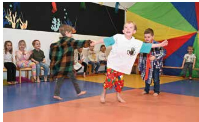
Die kleinen Zirkuskünstler waren mit Feuereifer bei der Sache