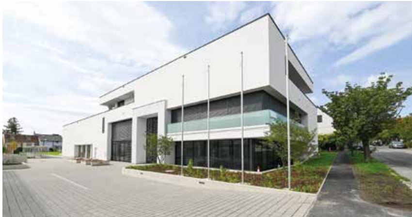
Die Errichtung des Gemeindeamts wurde mit dem Qualitätszeichen für nachhaltige Wohn- und Dienstleistungsgebäude klimaaktiv Bronze ausgezeichnet.

das großzügige Foyer, das als multifunktionaler Raum konzipiert wurde. Es eignet sich gleichermaßen als Veranstaltungsbereich wie als Pausenraum für den angrenzenden Saal – das Atrium. Garderobenbereiche, flexibel adaptierbare Sitzgelegenheiten, Ausschank, eine Gastronomieküche samt Kühlhaus sowie ein geschlossener Meetingraum machen diesen Bereich vielseitig nutzbar.