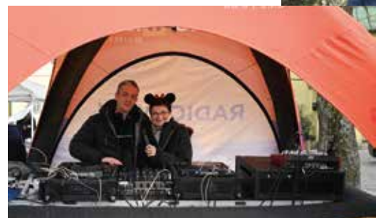
Beste Stimmung bei herrlichem Wetter