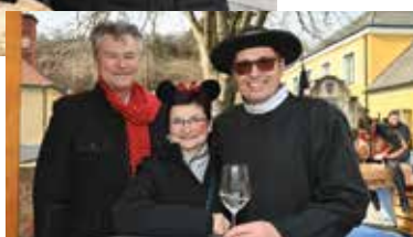
Kreative Ideen wohin man blickte