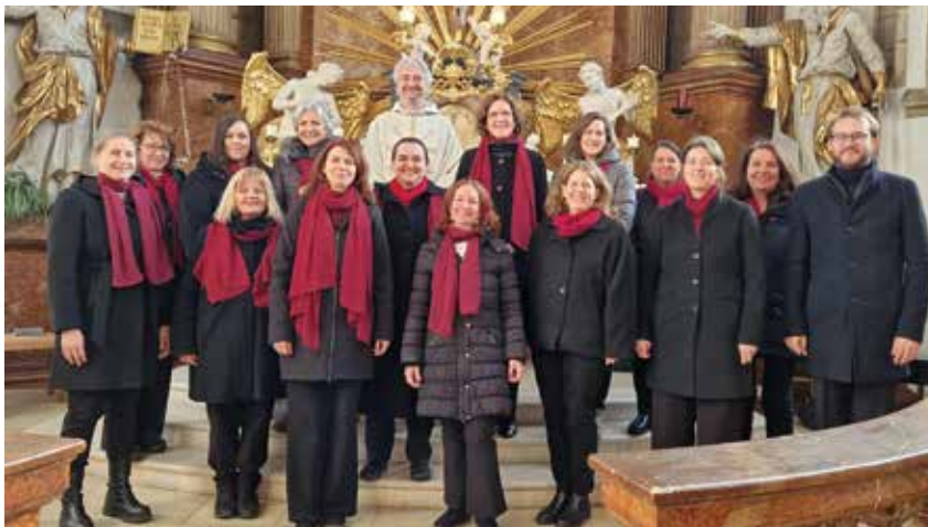
Der Frauenkammerchor Cantilena blickt auf eine auftrittsreiche Zeit mit vielen Highlights

Im Mittelpunkt der musikalischen Gestaltung stand die schwungvolle Jazzmesse Missa pro Juventute des jungen slowenischen Komponisten Tine Bec. Die 2019 entstandene Messe