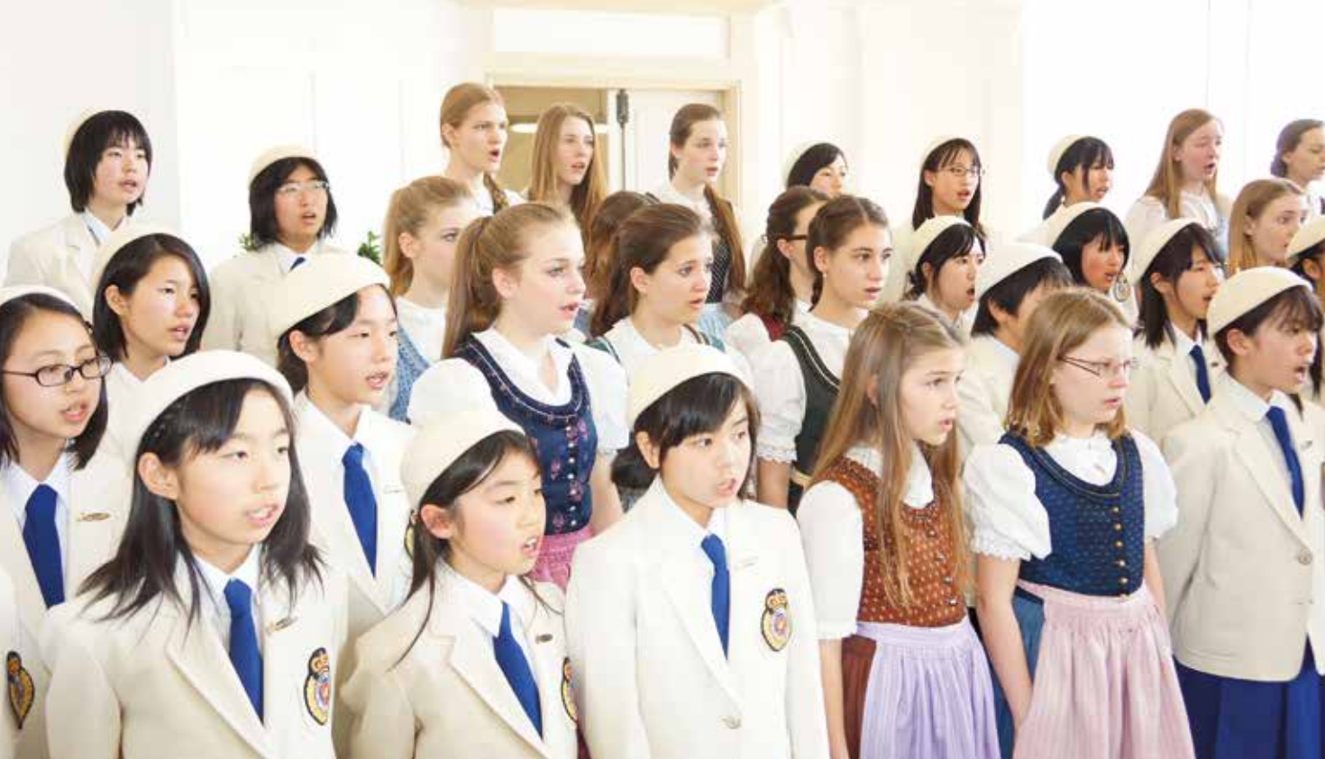
Die Gumpoldskirchner Spatzen und die Little Singers von Hyogo Inami beim gemeinsamen Konzert.