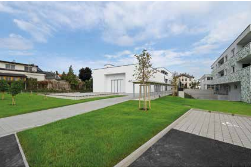
Der Sommer kann kommen - mit Open-Air-Events im Park