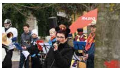
Ein herzliches Willkommen