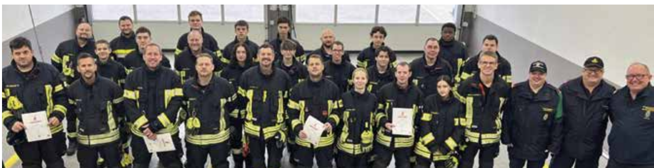
Die FF Gumpoldskirchen bewies mit der erfolgreich absolvierten Prüfung einmal mehr ihre gute Vorbereitung und Ausbildung.

chen, um im Ernstfall rasch, strukturiert und unfallfrei helfen zu können. Unter den strengen Augen der Bewerter arbeiteten die Gruppen die geforderten Stationen diszipliniert, präzise und innerhalb der vorgegebenen Zeit ab, was die gute Ausbildung widerspiegelt. <<