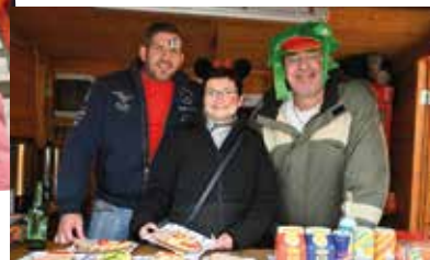
Auch für das leibliche Wohl war gesorgt