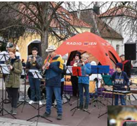
Das Musikschul-Blechbläserensemble legte sich ins Zeug