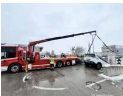
Ein Pkw war über die Ladekante gerutscht