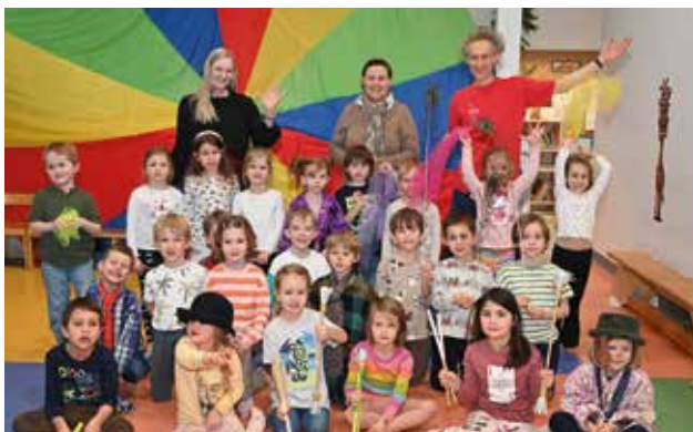
Die Darbietungen verzauberten das Publikum