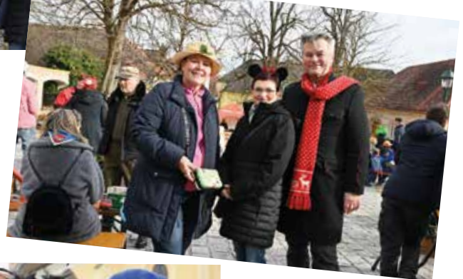
Der Kirchenplatz verwandelte sich einmal mehr in eine Festzone