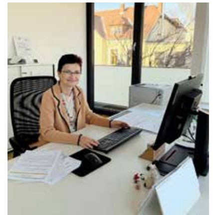
Die Bürgermeisterin freut sich auf Ihren Besuch und den persönlichen Austausch. „Viele gute Lösungen entstehen im persönlichen Gespräch, deshalb freue ich mich über jede Begegnung“, betont sie.

Ihre regelmäßigen Sprechstunden – montags von 8 bis 9 Uhr sowie dienstags von 18 bis 19 Uhr – unterstreichen den Anspruch auf Bürgernähe; individuelle Termine sind nach Vereinba-