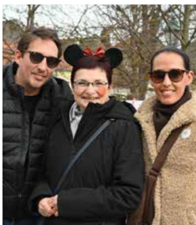
Juweliere in Faschingslaune