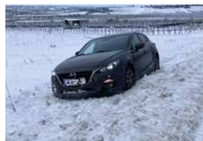
Ein Pkw war in den Graben gerutscht.

Sperre der Südbahn. Nach dem Streudienst konnte der Lkw weiterfahren. Kurz darauf wurde ein Pkw auf der Weinbergstraße, der in den Straßen Graben gerutscht war, mithilfe von Hebekissen und Seilwinde geborgen. Verletzt wurde niemand. <<