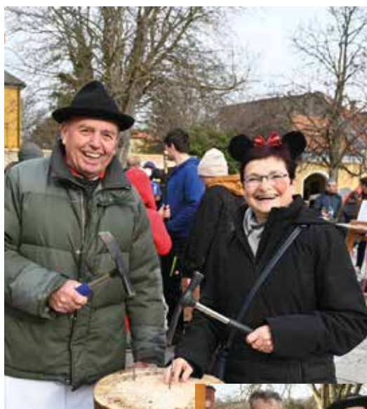
Die Faschingsgilde und das Tourismusboard organisierten auch heuer wieder eine tolle Faschingsmeile