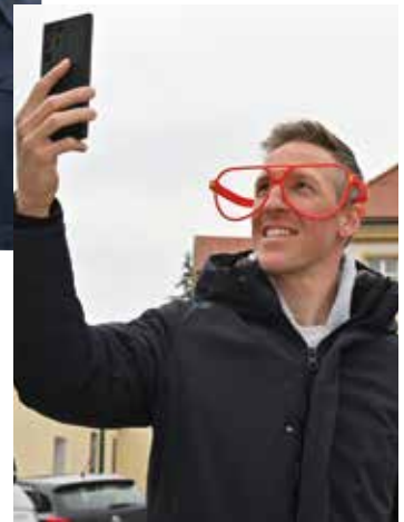
Irgendwas ist zu groß geraten ...