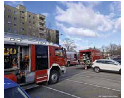
Unsere Feuerwehr unterstützte

Schnelleinsatzzelt mit Heizung für die Atemschutztruppe und stellte die Einsatzbereitschaft für den Ortsschutz der Gemeinde Wiener Neudorf. Die Feuerwehr Gumpoldskirchen stand mit 24 Mitgliedern und 5 Fahrzeugen rund 4 Stunden im Einsatz. <<