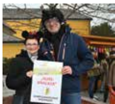
Die Pfadis als Nussknacker