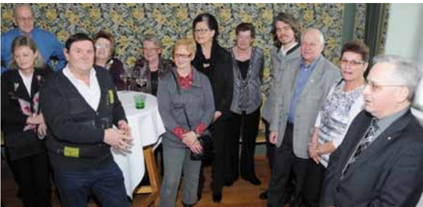
Zahlreiche Vereinsobleute waren gerne gekommen, um gemeinsam einen geselligen Vormittag zu verbringen. Für kleine Schmankerln und Getränke sorgte das Gastronomieteam von der Gastwirtschaft „3er Haus“ am Schrankenplatz.

rienspiel zu setzen, auch forderte er Gumpoldskirchens Senioren und die Kirche zum Mitmachen auf. Schabl wiederum plant, den Jugendlichen „Das Rathaus – das unbekannte Wesen“ näherzubringen. Mit einem Beisammensein bei Buffet und vielen angeregten Gesprächen klang der Vormittag gesellig aus.