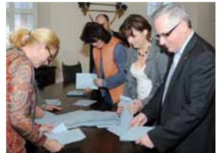
Die Stimmauszählung im Rathaus zur Volksbefragung.