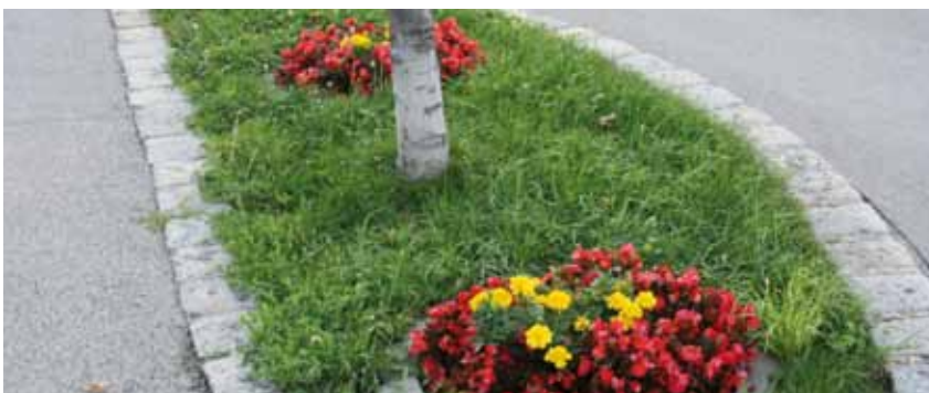
Mit viel Engagement werden auch viele Rabatte im Ort liebevoll gepflegt.

Insgesamt warten zehn schöne Preise auf Gumpoldskirchens Hobbygärtnerinnen und Hobbygärtnern, die im Rahmen einer kleinen Feier vergeben werden. Schmücken Sie Ihre Fenster, Eingangsbereiche, Vorgärten und Baumscheiben vor Ihrem Haus, denn Sie tragen damit auch zur Ortsbildgestaltung bei! Die Hege und Pflege des Bereiches vor Ihrem Haus erfreut auch Gumpoldskirchens Gäste, sie schätzen den Gesamteindruck, zu dem Sie im Rahmen des Blumenschmuckwettbewerbes viel beitragen können.