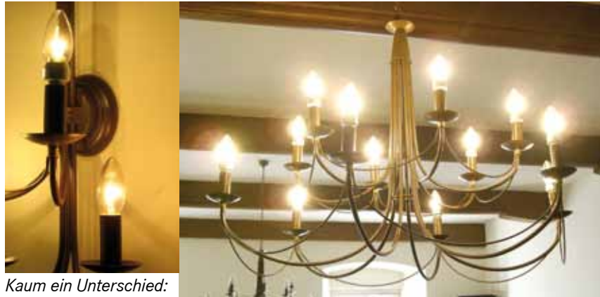
Kaum ein Unterschied: rechts unten Glühbirne, links oben LED. Vorher 480 Watt – jetzt 48 Watt – und ein bisschen heller!

Nachdem mit der sogenannten „Energiebuchhaltung“, einem regelmäßigen Ablesen von Zählerständen zu Jahresbeginn gestartet wurde, konnte nun auch der Sitzungssaal auf energieeffiziente Leuchtmittel umgestaltet werden. Dabei war es aber sehr wichtig, den Charakter beizubehalten – es sollten wieder „Glühbirnen“ eingesetzt werden. Seitens der Firma softLED (Light Emitting Diode) wurde eine neuartige Glühbirne in LED Technologie präsentiert.