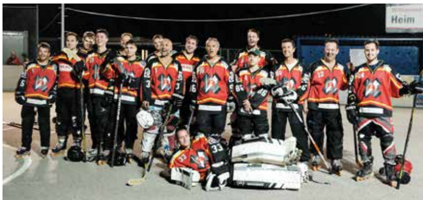
So sehen Vizemeister aus! Lokomotive Gumpoldskirchen

Die Weinortler aus Gumpoldskirchen wurden verdient Vizemeister, sie gewannen die vier Spiele gegen den Drittplatzierten Inlinewölfe Ternitz und die Red Dragons Altenberg.