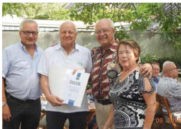
Sommerfeste gehören zu den traditionellen Zusammenkünften der NÖ Senioren