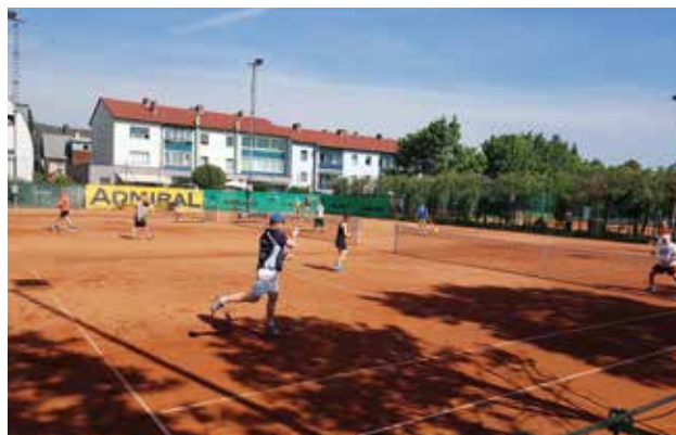
Tennis – Sportart mit Mehrwert für alle Generationen

Wir wollen die Neugier an unserem wunderbaren Sport wecken und möglichst viele Interessierte für Tennis begeistern. Unsere Ersteinsteiger bekommen einen lockeren