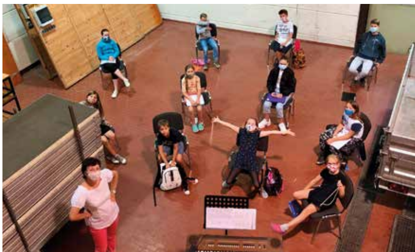
Die Bestimmungen zur Eindämmung von COVID-19 verlangten auch den Spatzen so einiges ab

Trotz der erschwerten Probenbedingungen haben wir es geschafft, Ende Juni ein wunderschönes Abschlusskonzert in der St. Othmar Kirche in Mödling zu geben, bei dem wir nicht nur Chorstücke präsentierten, sondern auch unsere Solisten viel Platz für ihre Darbietungen bekommen haben.