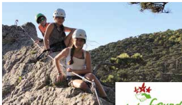
Junge Gipfelstürmer am Efeugrat Mödling/Hinterbrühl

Ein umfangreiches Kursangebot für Einsteiger und Fortgeschrittene sowie Broschüren und Ratgeber bieten Hilfe, die passende Freizeit- und Fitnessaktivitäten zu finden. Jedes Mitglied genießt die Sicherheit einer weltweiten Freizeit-Unfallversicherung bzw. Haftpflichtversicherung. Die Ortsgruppe Gumpoldskirchen kümmert sich um die Mitgliederbetreuung und fungiert nur im kleinen Umfang als direkter Anbieter von Freizeitangeboten, wie geführte Wanderungen in der Umgebung und Kletterkurse bzw.