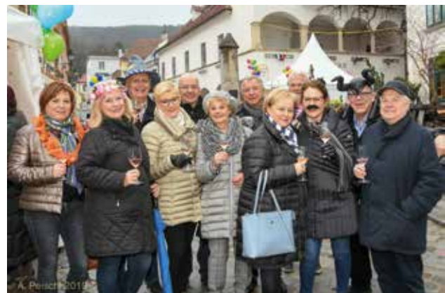
Faschingsdienstag mit dem Tourismusboard