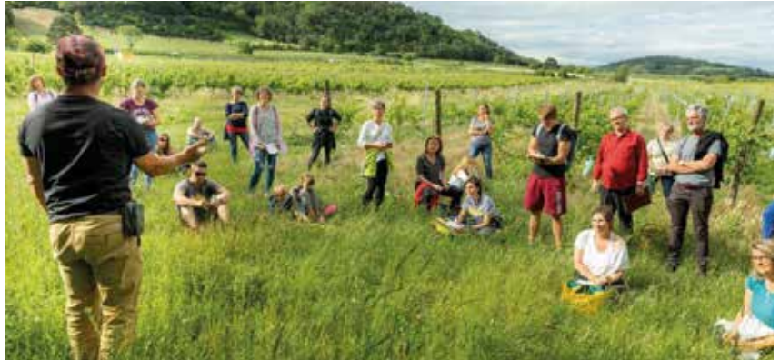
Eine Idee wurde zum Erfolgskonzept: regio-gumpi

Das Wiedererlernen, sich zumindest zum Teil, mit Lebensmitteln selber zu versorgen, ist unser zentrales Anliegen. Dabei biologisch und nachhaltig zu wirtschaften und die Zusammenhänge in der Natur zu verstehen – wir können nur mit der Natur wirtschaften,