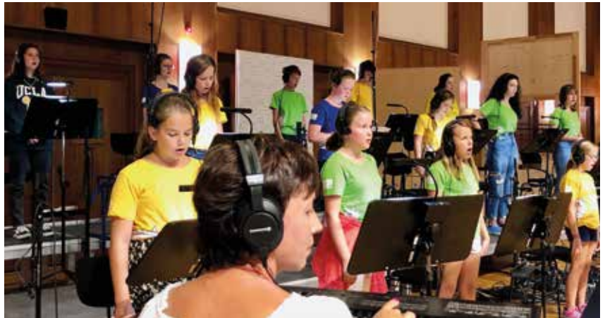
Die Spatzen wurden kurzfristig zu Aufnahmen für den Kinderfilm Peterchens Mondfahrt ins Synchron Stage Studio eingeladen ...