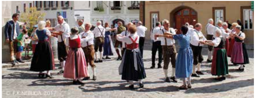
Bei allen Festen vertreten: Die Volkstanzgruppe