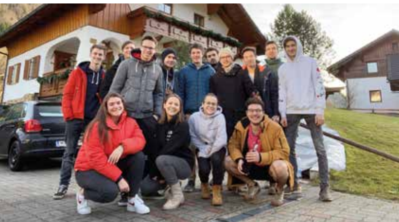
Die Eulenspiegel haben die Jugend im Blick

Verein zur Vertretung der Interessen der Gumpoldskirchner Jugend