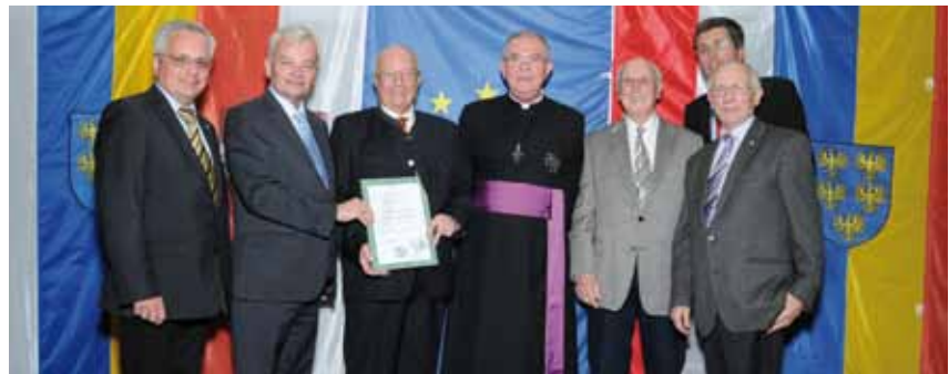
Zahlreiche Ehrungen und Danksagungen gab es im Rahmen der Festlichkeiten.